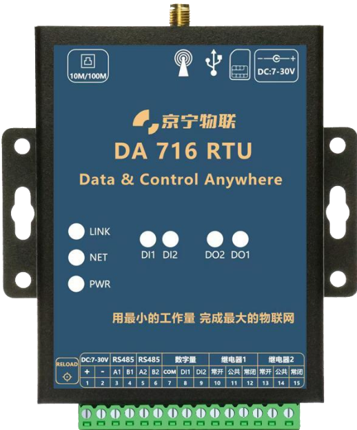
图 3 RTU 实物图