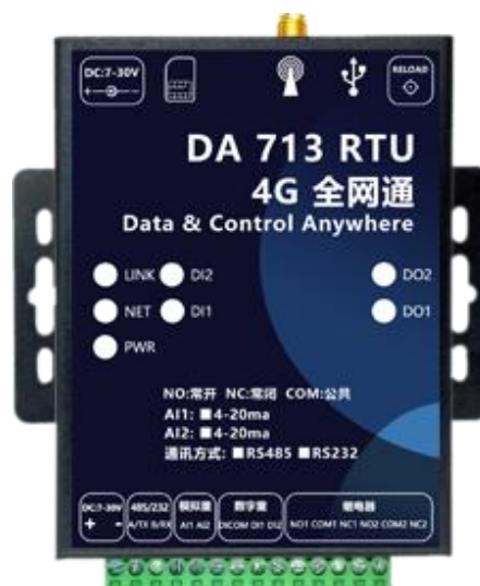
图 3：RTU 实物图